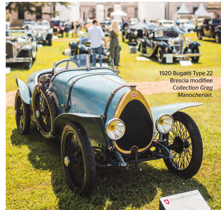
1920 Bugatti Type 22 Brescia modifiée Collection Greg Manocherian.