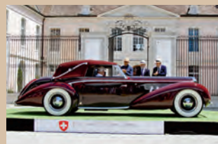
1937 Delage D8-120 cabriolet Chapron Collection Merle & Peter Mullin