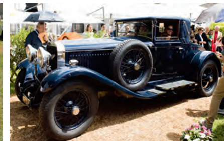
1927 Hispano Suiza H6B The Keller Collection.