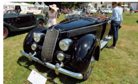
1936 Lancia Astura Bocca cabriolet serie 3 Pinin Farina Collection Anthony MacLean.