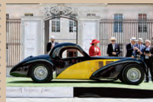
1937 Bugatti Type 57 Atalante Musée National de l'Automobile