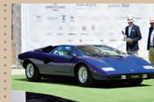
1977 Lamborghini LP400 Collection Simon Kidston