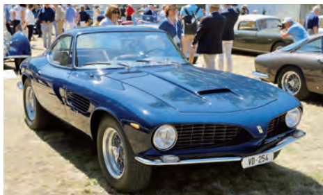
1962 Ferrari 250 GT Berlinetta speciale Collection Privee.