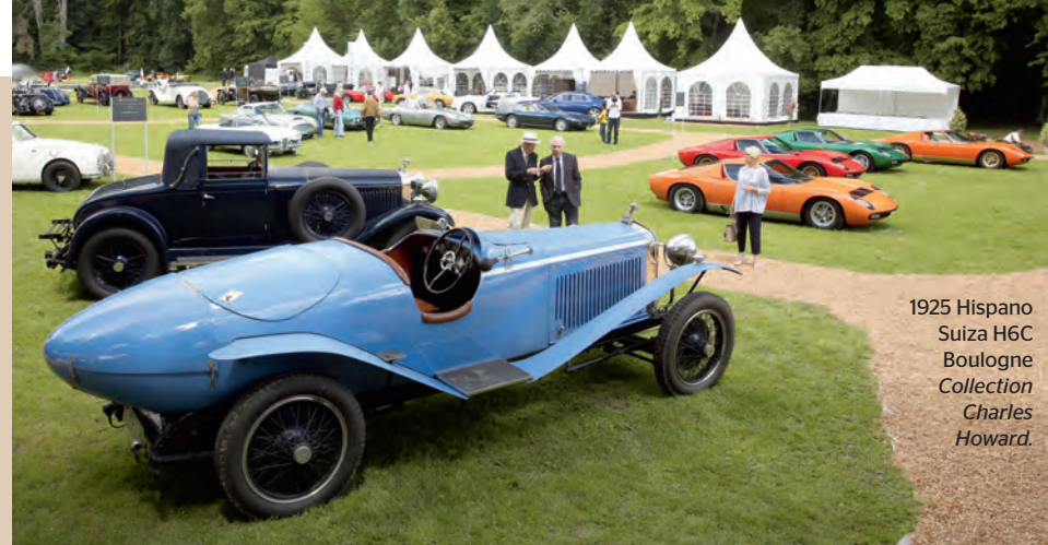
1925 Hispano Suiza H6C Boulogne Collection Charles Howard.

info@barbara-bertoli.com +41 76 369 89 75.