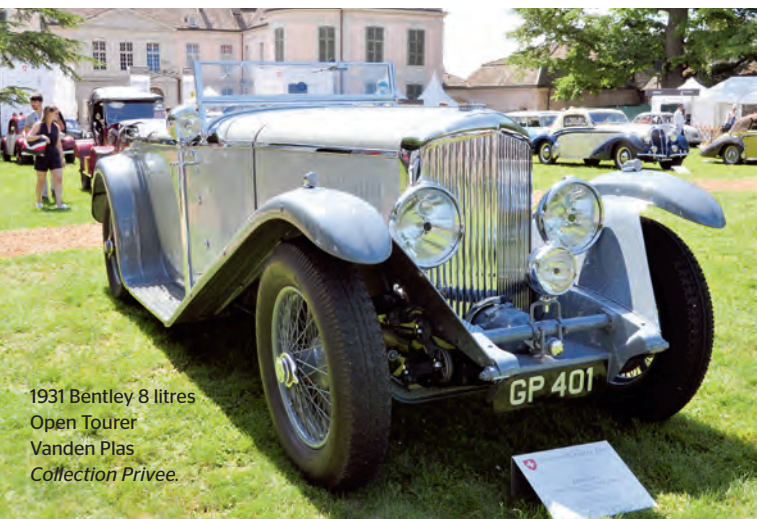
1931 Bentley 8 litres Open Tourer Vanden Plas Collection Privée.