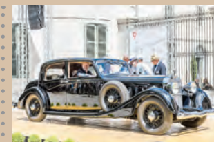
1937 Hispano Suiza K6 Collection Martin Waltz